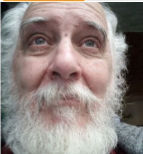
José Arturo Quarracino